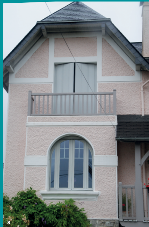
8. Maison de style balnéaire à Oloron Sainte-Marie

Le développement des constructions de logements est mis à mal avec la Seconde Guerre mondiale. Puis la fin du conflit annonce une nouvelle reprise voire une accélération pour répondre aux destructions et au besoin de s'abriter.