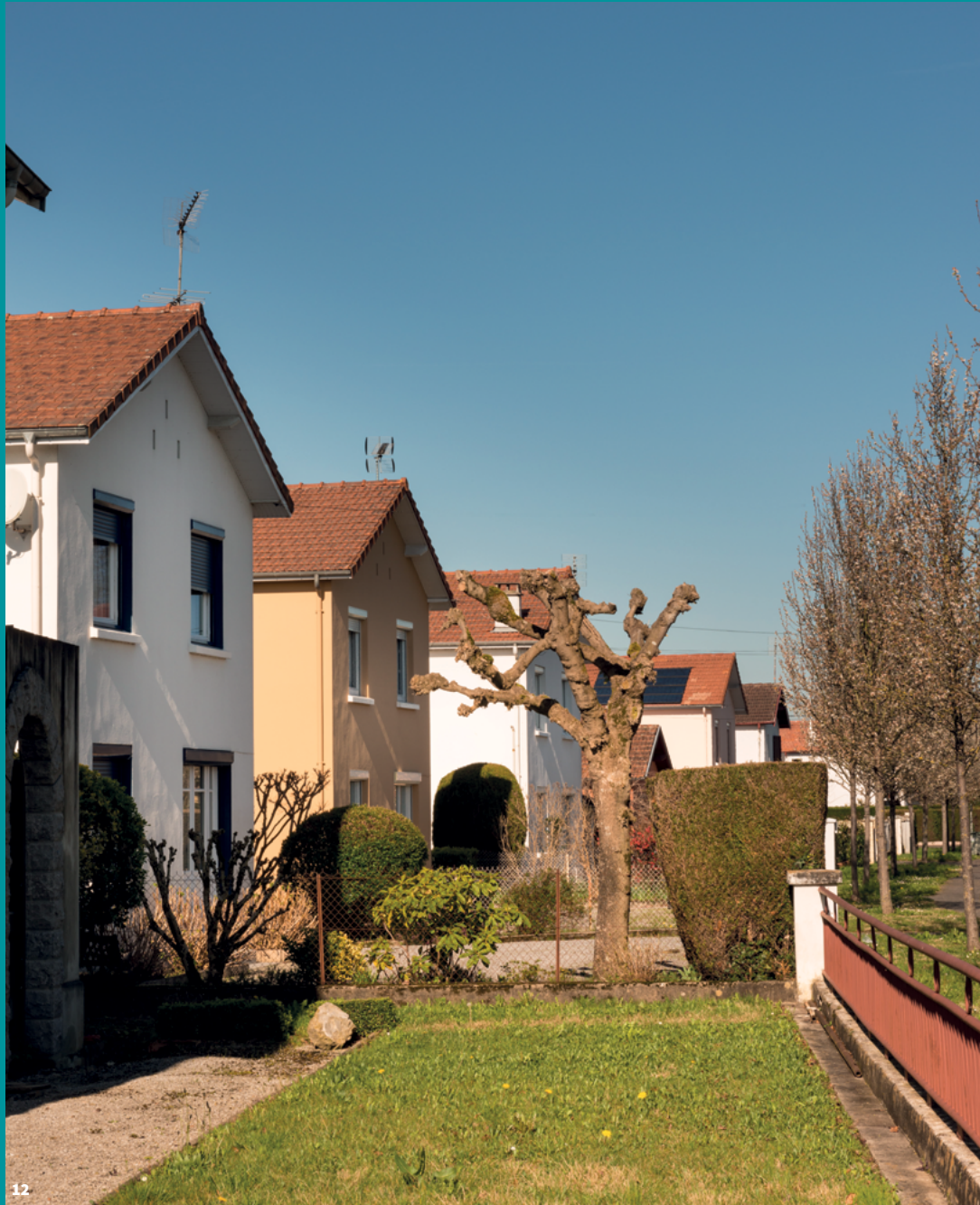
12. Les maisons du quartier Pondeilh à Oloron Sainte-Marie