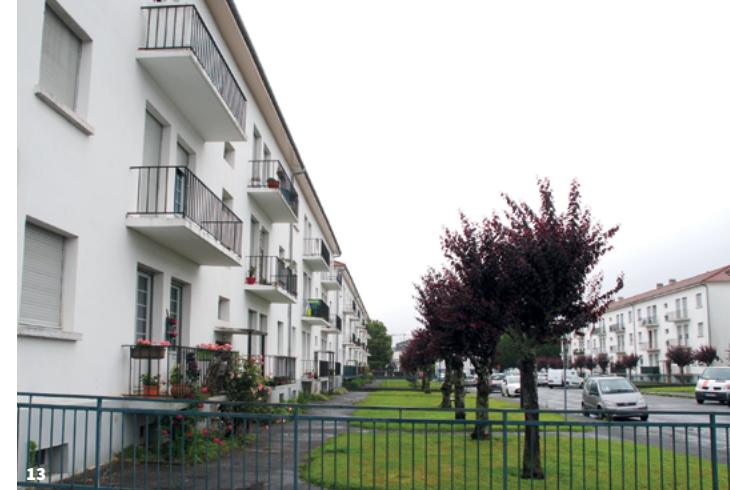
13. L'ensemble de logements de la cité Marlats à Oloron Sainte-Marie

l'existence d'un garage accolé, une entrée sous porche ou encore un balcon d'angle au premier niveau.