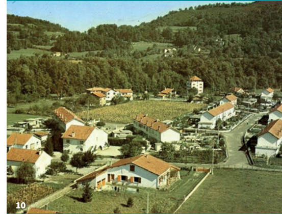
10. Le quartier des Castors à Arudy