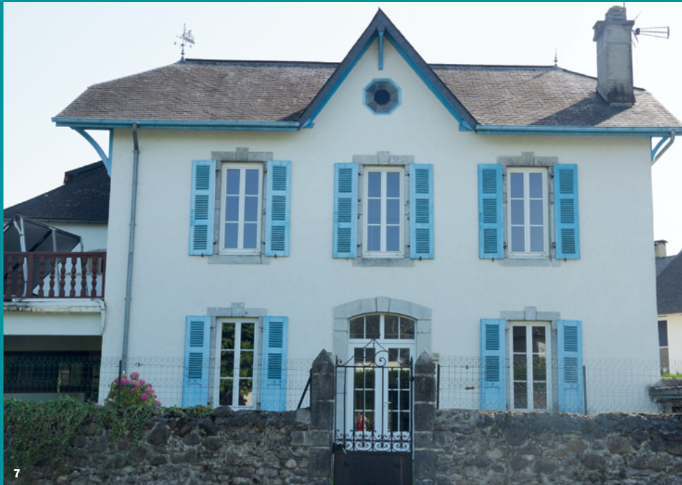
7. Maison classique à fronton à Lanne-en-Barétous